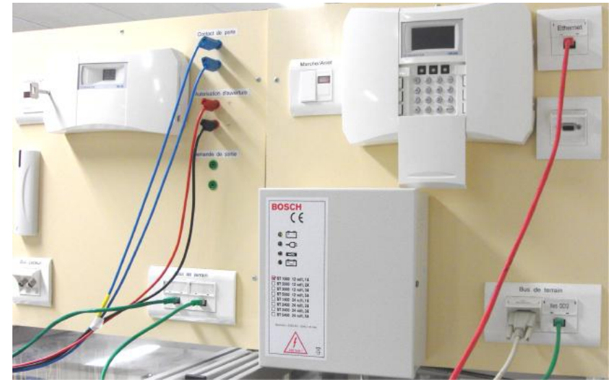
Contrôle d'accès communicant

Les Sciences de l'Ingénieur pour comprendre comment un produit ou un système complexe fonctionne.